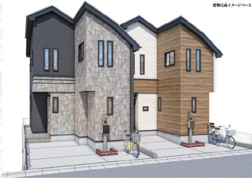
建物完成イメージパース